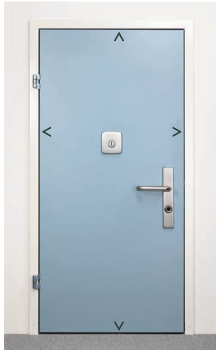
Multilock Typ 220