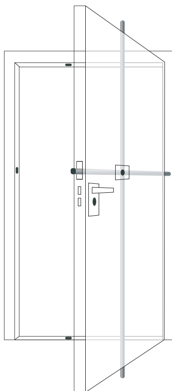
Multilock Typ 200/220

Einsteckverriegelung mit Falle und Wechsel. Sechs Verriegelungsstangen.