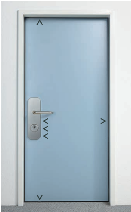
Multilock Typ 245