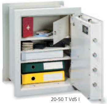
20-50 T VdS I