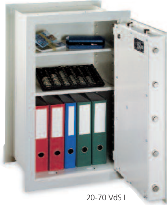
20-70 VdS I