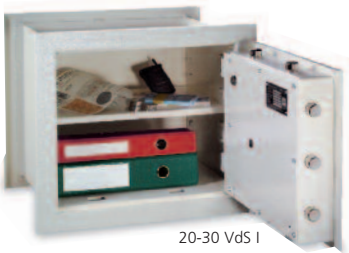
20-30 VdS I