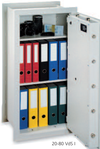
20-80 VdS I